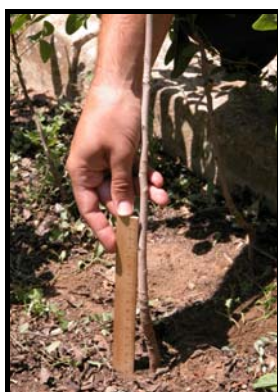
FOTO N° 7 - Cornicabra de dos crecimientos preparada para ser injertada