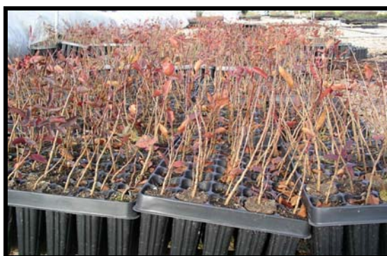
FOTO N° 1 – Planta de un crecimiento de Pistacia terebinthus – Cornicabra - en alvéolos)

A la hora de elegir este pie debemos de tener en cuenta que “cornicabras” procedentes de zonas cálidas pueden verse perjudicadas por los fríos primaverales ya que, normalmente, inician su actividad vegetativa antes y la finalizan después que las procedentes de zonas más frías. Sólo en aquellas zonas donde los fríos del mes de marzo no sean demasiado intensos podría ser una buena opción la plantas con estas características