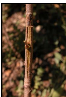
FOTO N° 14 – Yema introducida en el portainjerto donde los cortes superiores deben quedar unidos perfectamente