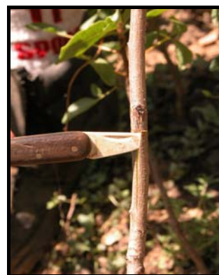
FOTO N° 13 – Separación de las dos solapas del pie antes de la introducción de la yema