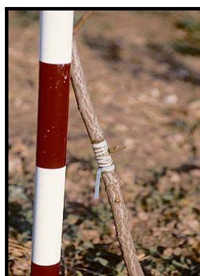
FOTO N° 16 – Yema brotando al cabo de unos veinte días después de injertada. No se debe tocar la copa del portainjerto