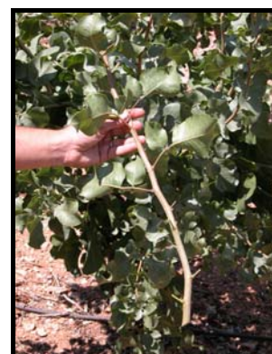
FOTO N° 9 – Vareta recogida del pie madre de la que se eliminan las hojas lo antes posible